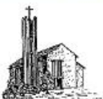
St. Bernward, Nienburg